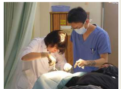
過去の実習の様子