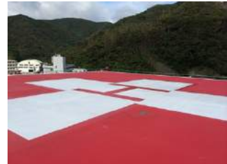
救命救急センター屋上のヘリポート