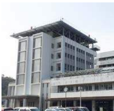
救命救急センター外観