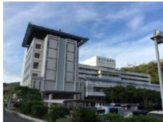
建物左は新設された救命救急センター