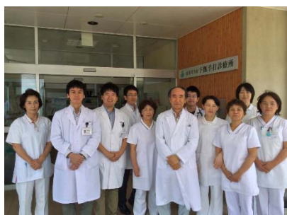
手打診療所の皆さまと