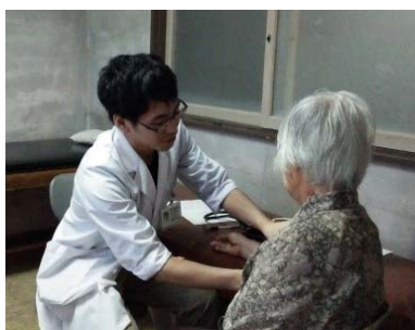
片野浦診療所での診療実習