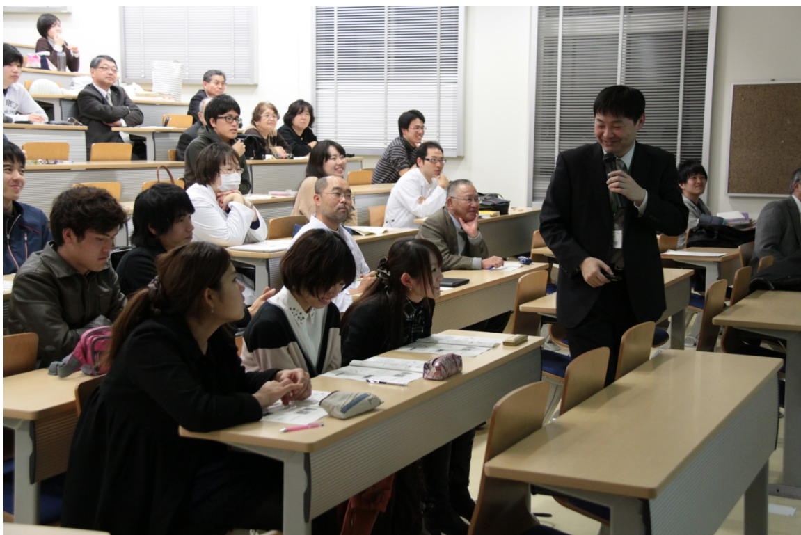
第13回鹿児島地域医療教育講演会の様子

今後とも、地域推薦枠医学生達が地域医療にやりがいを持って進めるように育成の支援を行っていききたいと考えています。