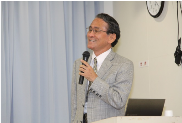
第11回鹿児島地域医療教育講演会