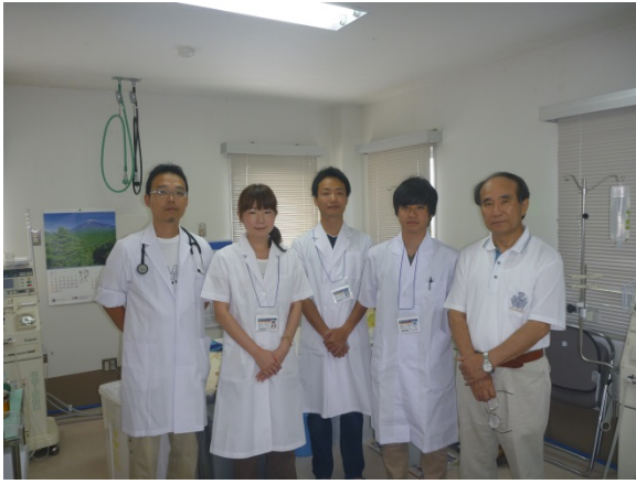
夏季離島実習(学士編入3年生)