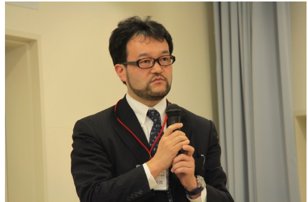
第12回鹿児島地域医療教育講演会