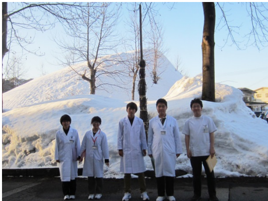
県外病院実習(新潟県立小出病院)