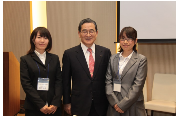
離島・へき地医療研修会/懇親会