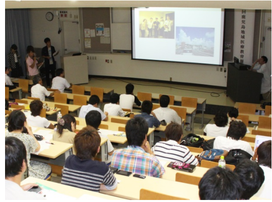
離島実習報告(徳之島コース)