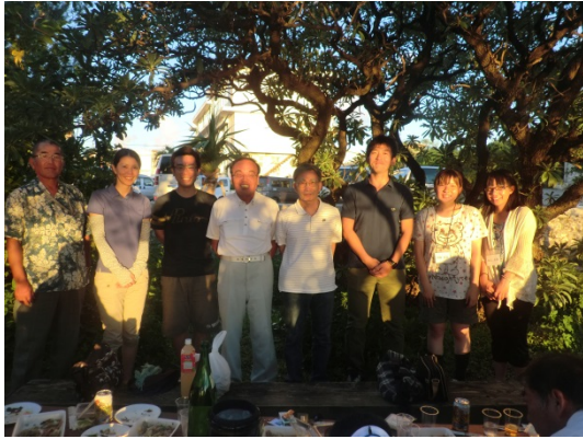
夏季離島実習(与論島コース)