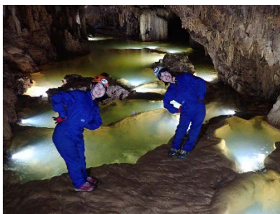
地域診断実習(沖永良部)