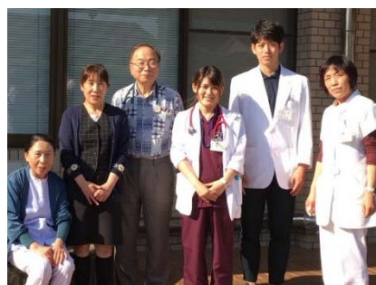
お世話になった先生方と