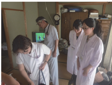
夏季離島実習(長島コース)