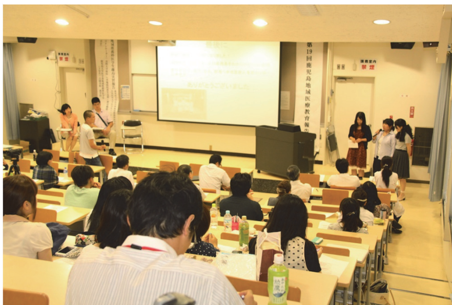
第19回鹿児島地域医療教育報告会の様子

今後とも、地域推薦枠医学生達が地域医療にやりがいを持って進めるように育成の支援を行っていきたいと考えています。